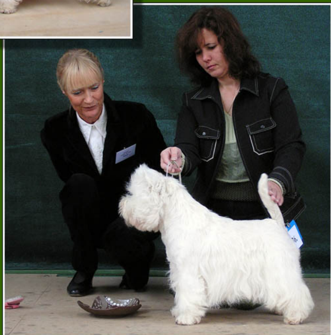
Vítěz speciální výstavy 2004, BOB