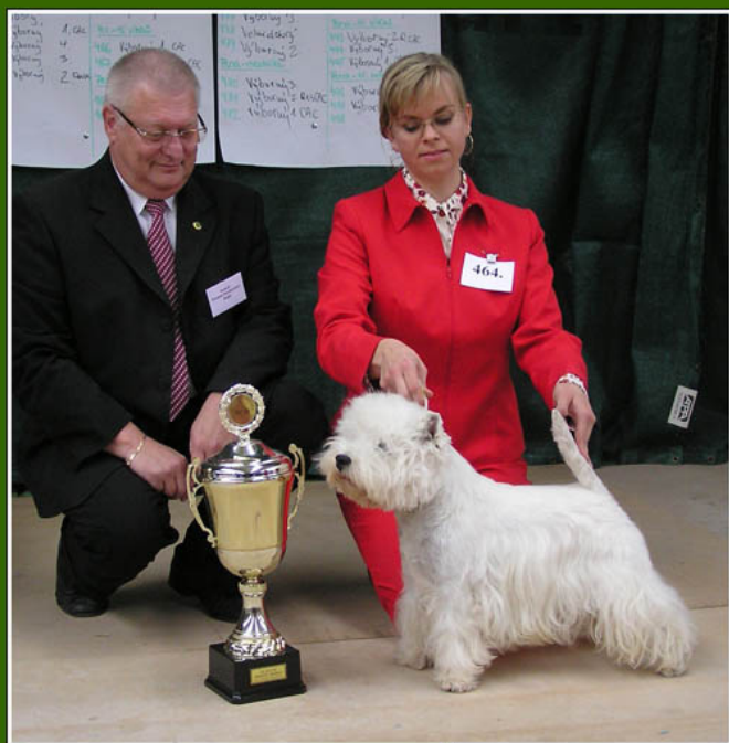
Klubový vítěz 2004, BOB